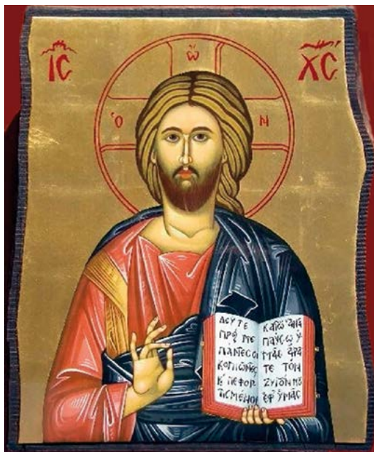
Icona de Crist Pantocràtor

En aquest sentit el llibre de la Sagrada Escrip- tura, que sosté a la seva mà esquerra, s'ha de veure en continuïtat amb la seva humanitat, amb la túnica que cobreix el seu mantell. Totes les