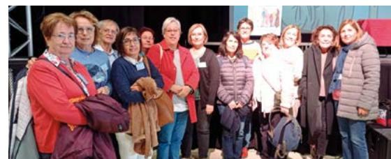
Catequistes de la diòcesi de Sant Feliu de Llobregat participants a les Jornades

Uns dies plens de moments d'oració, relacions, visites culturals i formació al voltant del tema que els ha-