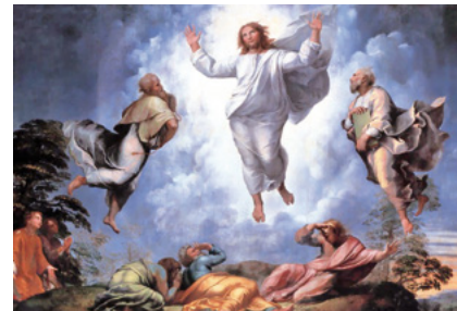
La Transfiguració (1517-1520), de Rafael Sanzio. Pinacoteca Vaticana, Ciutat del Vaticà (Itàlia)