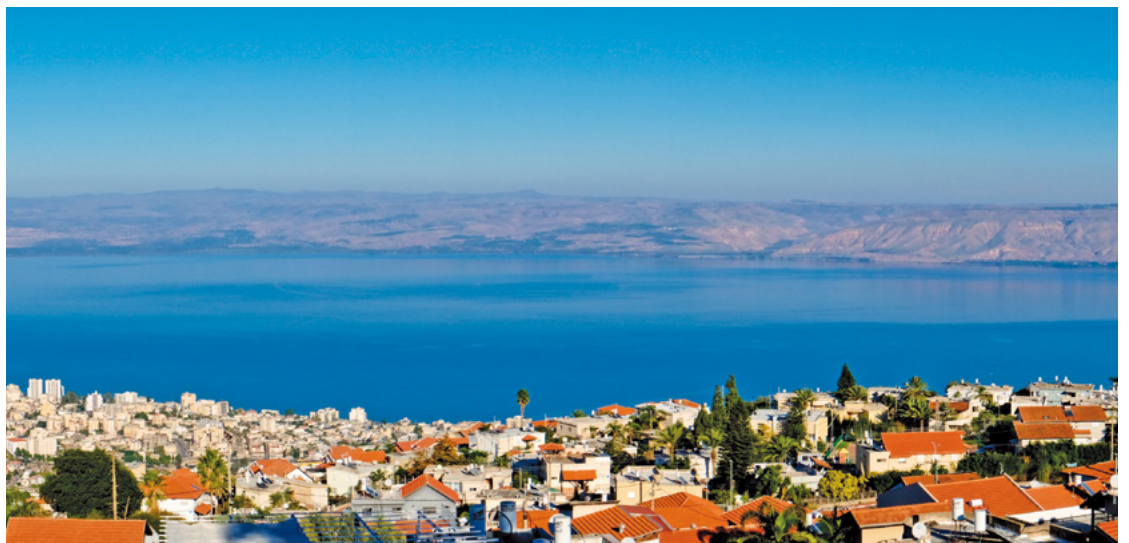
Mar de Galilea

Això cal intentar-ho tenint en compte que els canvis són necessaris. La vida de la fe té la seva història. Hom no pot creure de la mateixa forma que creia quan era nen o adolescent. La fe essencialment és la mateixa. Però la vida va canviant, es van despertant interrogants, hi ha recerques i moments