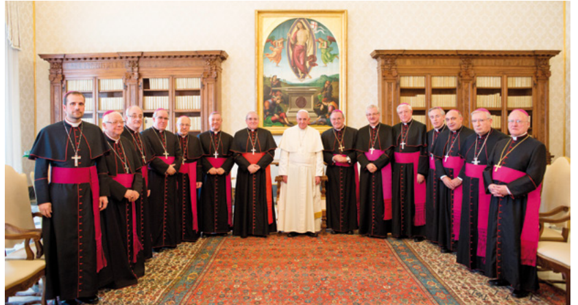
Visita ad limina apostolorum 2014 dels bisbes de la Tarraconense

També mantindran reunions en alguns dicasteris de la Cúria romana: dels Bisbes, de la Doctrina de la