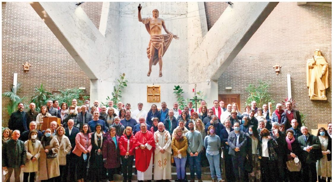
Participants a les XXXIX Jornades de delegats de Pastoral de Família i Vida del 6 novembre 2021

La tarda va ser més de treball, en relació als preparatius de la Setmana del Matrimoni i de la Troba-