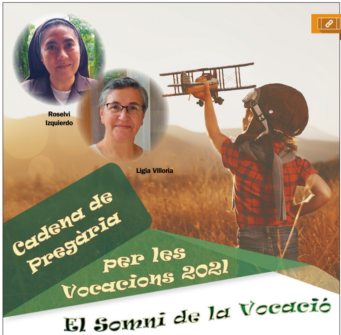
Les germanes Roselvi i Ligia, carmelita de Sant Josep i sierva de San José, respectivament, ens han donat el seu testimoni vocacional a la llum de la figura de sant Josep

Si vols pregar en cadena per les vocacions, pots inscriure't per deixar constància de la teva oració al web www.cadenadepregaria.cat , on trobaràs també materials i altres recursos. Els dies reservats per al Bisbat de Sant Feliu de Llobregat són el 9, 19 i 29 de novembre.