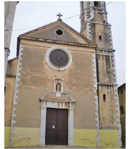
Església de Santa Maria de la Geltrú de Vilanova i la Geltrú