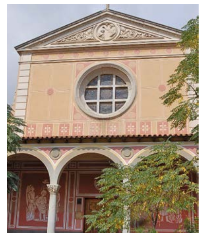
Església de Sant Joan Baptista de Viladecans