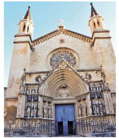
Basilica de Santa Maria de Vilafranca del Penedès

La proposta és concentrar aquesta activitat el dissabte 26 al migdia i compartir a les xarxes socials imatges i vídeos que mostrin aquest esperit de Lourdes.