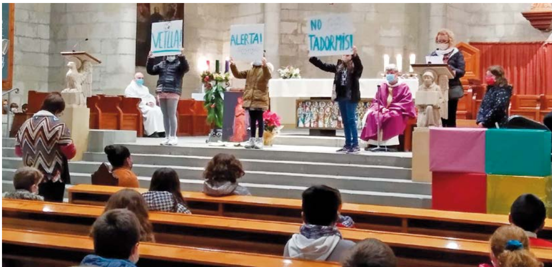
Eucaristia celebrada a la basílica de Santa Maria de Vilafranca del Penedès

Així és com està funcionant durant aquest curs el projecte «Catefamily», de la Catedral-Parròquia de Sant Llorenç, a Sant Feliu de Llobregat, del qual ja hem parlat al Full Dominical . Entre altres exemples similars, des de Vilafranca del Penedès ens expliquen el següent: