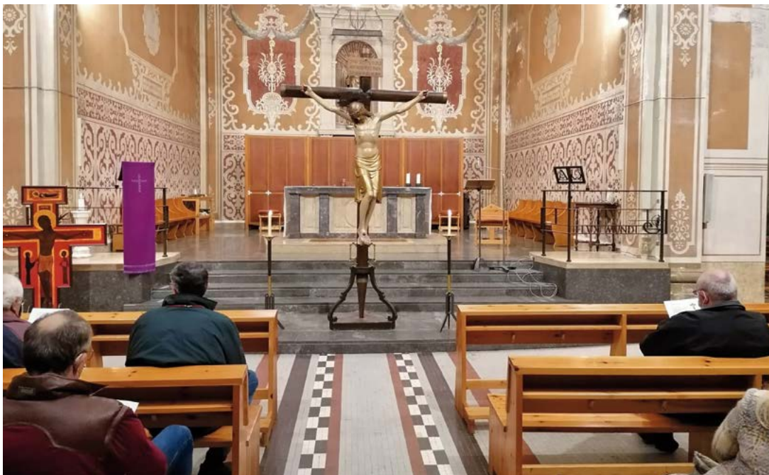
Pregària al Sant Crist de Sant Sadurn d'Anoia