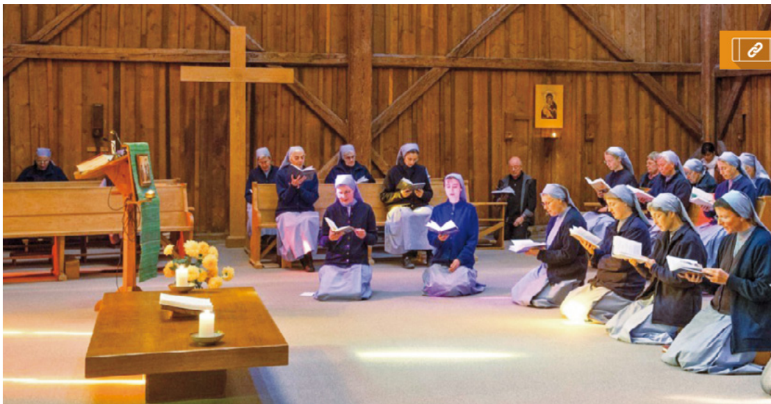
Comunitat monàstica de Grandchamp

Enguany, els materials han estat preparats per la comunitat monàstica de Grandchamp, coneguda també com «les senyores de Morges». Es tracta d'una comunitat monàstica de germanes que avui dia compta amb una cinquantena de membres, de diferents edats, tradicions, països i continents. En la seva diversitat, les germanes són una paràbola viva de comunió i es mantenen fidels a la vida de pregària, a la vida de comunitat i a l'acolliment dels hostes.