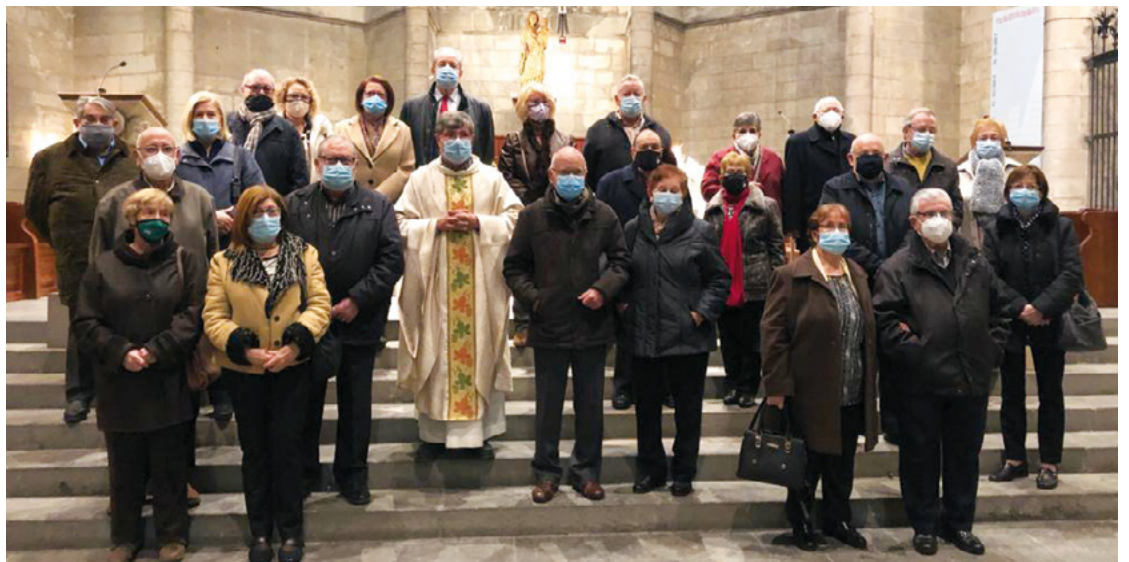
El diumenge de la Sagrada Família, 27 de desembre, 12 matrimonis en les seves noces d'or es van fer presents a l'eucaristia de la Basilica de Santa Maria, donant gràcies a Déu pel do del sagrament que els ha acompanyat en aquests anys, amb els seus fruits d'amor i fidelitat.

L'objectiu és oferir a l'Església oportunitats de reflexió i aprofundiment per viure concretament la riquesa de l'Exhortació Amoris Laetitia .